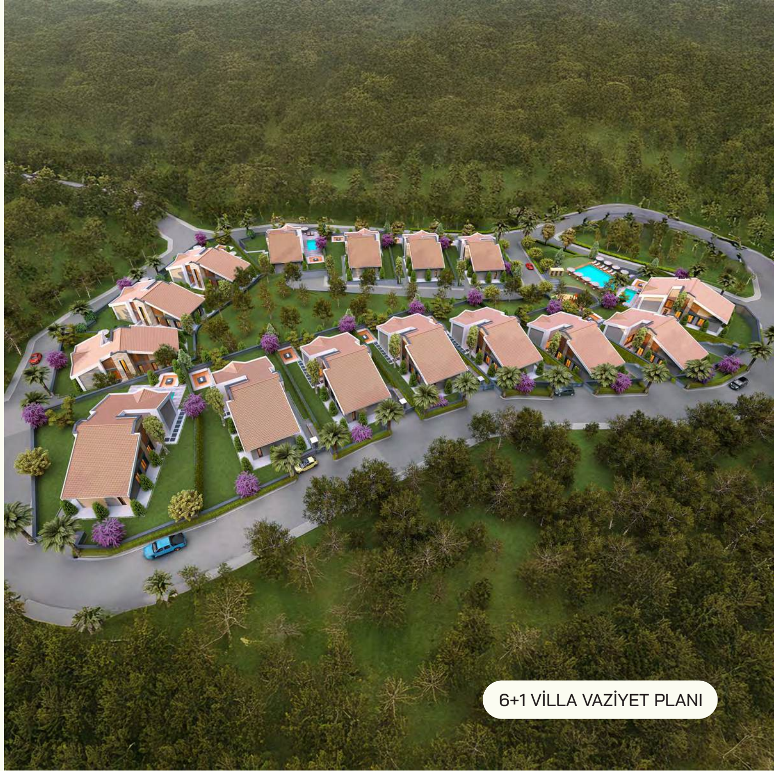
6+1 VİLLA VAZİYET PLANI