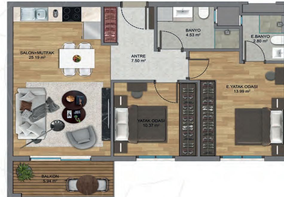
2+1A-Tip 2 (A BLOK )