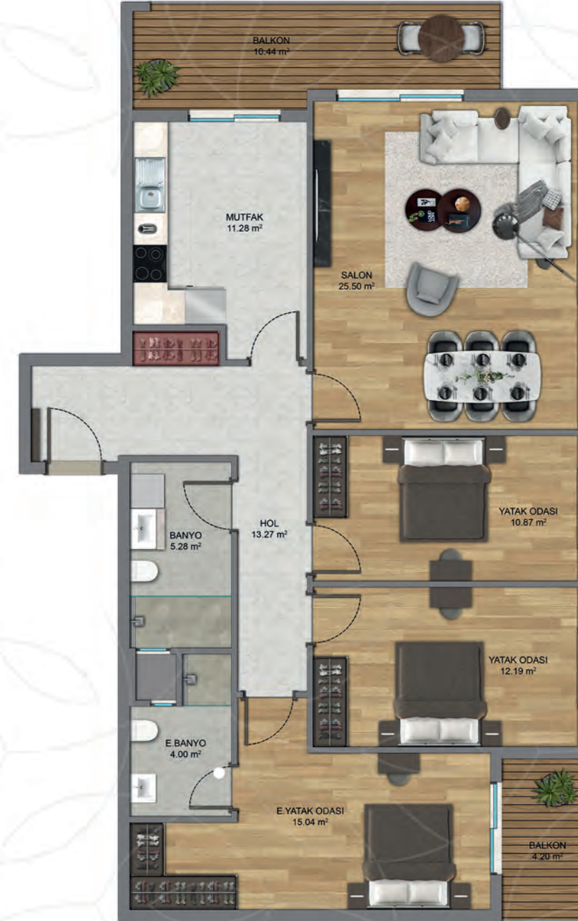
3+1 K Tip 1 (B BLOK)