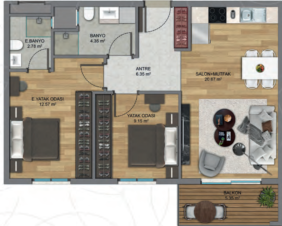
2+1A-Tip 1 (B BLOK )