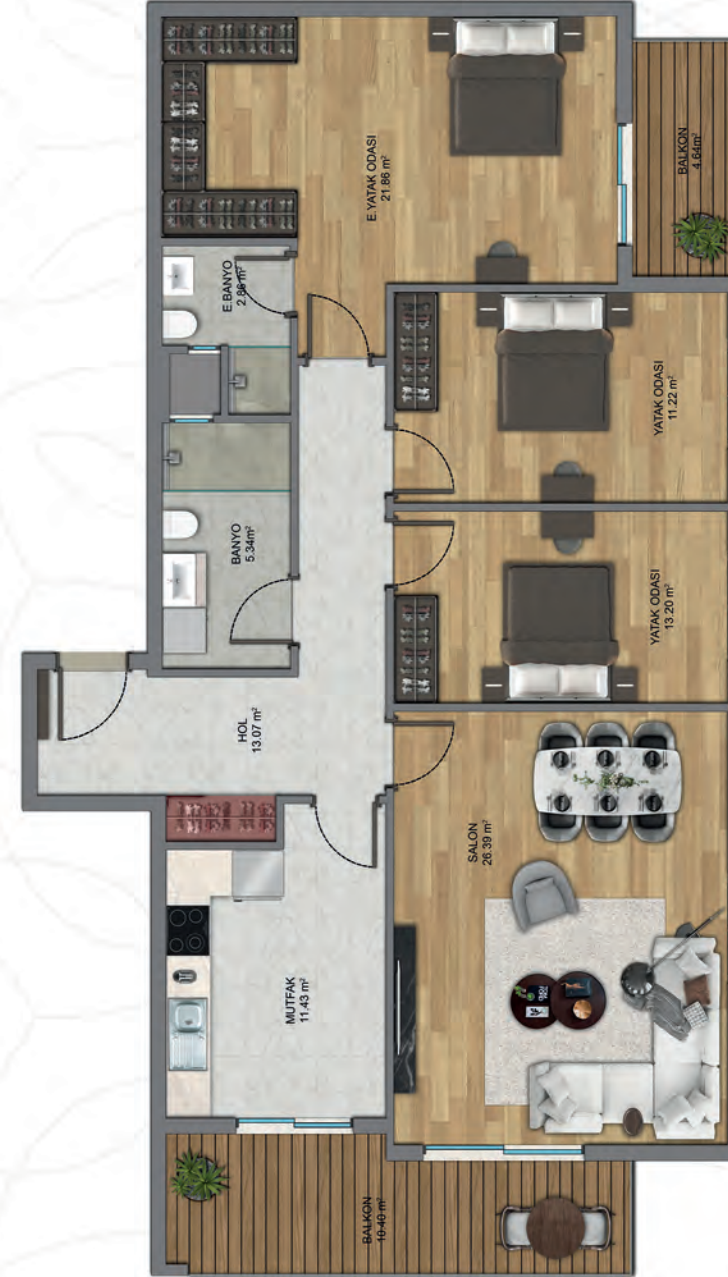
3+1 K Tip 1 (A Blok)